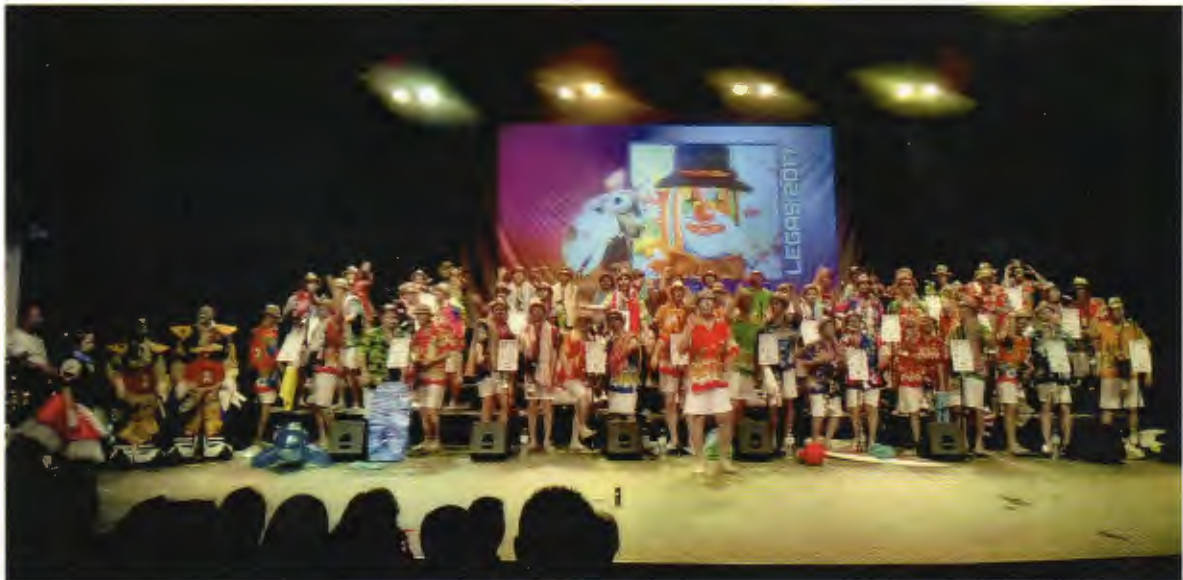
Presentación Murga Los Legañosos 2017