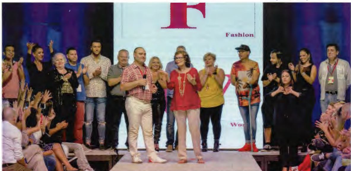
Asociación de Diseñadores de Las Palmas de Gran Canaria